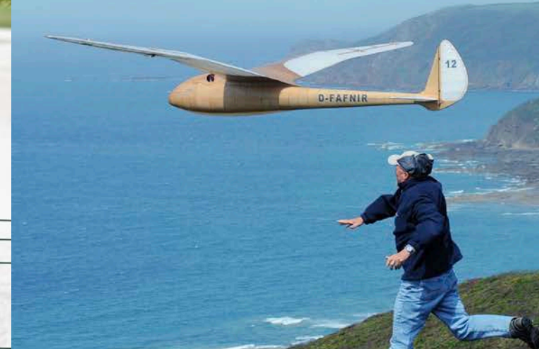
Départ d'un planeur sur la pente des Pierres Pouquélées, commune de Vauville.

Nombre de catégories pratiquées au HMAc : planeur, maquette, voltige F3A et F3M, hélicoptère F3C, racer, drones, planeur F3K, vol libre, vol indoor.