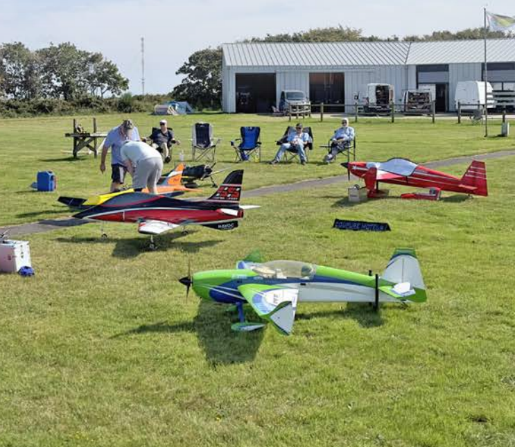
Le terrain du HMAc à Flottemanville-Hague.

Tous les week-ends, les membres s'y retrouvent pour faire voler leurs modèles mais aussi construire ou préparer les futurs projets et événements du club.