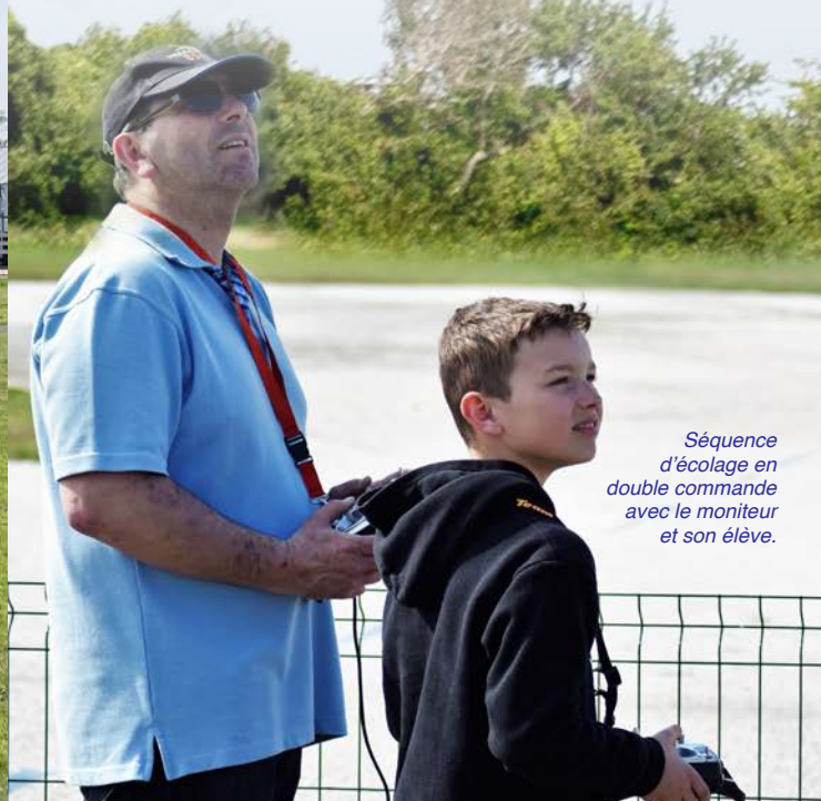
Séquence d'écologie en double commande avec le moniteur et son élève.

Pratiquer l'aéromodélisme ne se limite pas au pilotage d'un avion, d'un planeur ou d'un hélicoptère. C'est aussi l'opportunité de découvrir le travail de toutes sortes de matériaux (bois, composites, polystyrène...), la mécanique, l'électricité et l'utilisation d'outils (découpe à commande numérique, impression 3D...). Mais c'est aussi apprendre la météorologie, l'aérodynamique et bien sur les réglages complexes d'un modèle réduit.