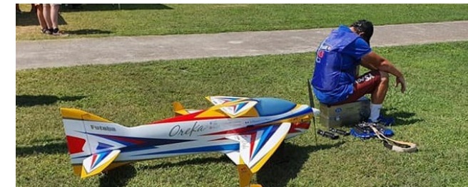
Championnat du monde 2019 : la voltige est un sport de concentration