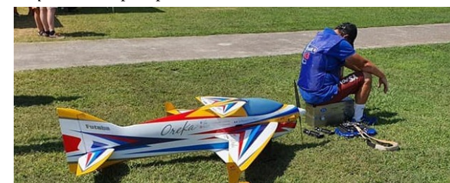
Championnat du monde 2019 : la voltige est un sport de concentration