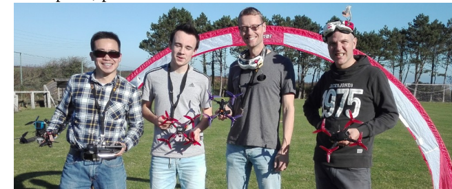
La section drone du HMAc se tourne également vers la compétition